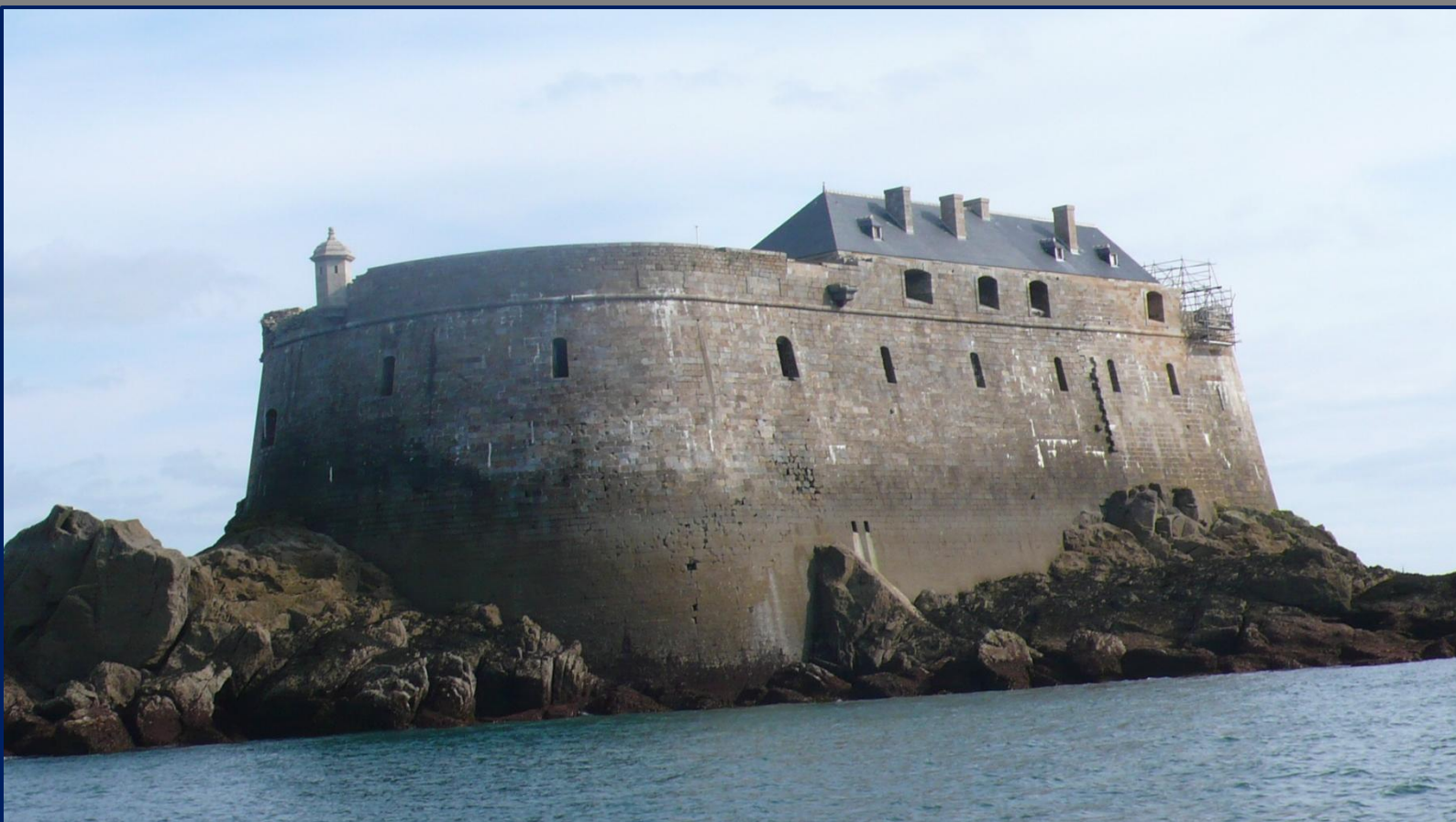
Fort de la Conchée

PARTENARIAT ENTRE LA COMPAGNIE DU FORT DE LA CONCHÉE ET LA FONDATION DU PATRIMOINE