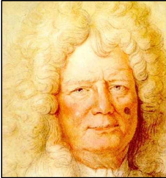
Portrait de Vauban

Sébastien le Prestre de Vauban est né en 1633, près d'Avallon, et devint à 22 ans l'ingénieur militaire du roi Louis XIV, qu'il servit pendant 53 années. De l'âge de 44 ans jusqu'à sa mort, le 30 mars 1707, il exerça la charge de Commissaire des Fortifications du royaume. Vauban a construit ou modifié plus de 170 sites en France et dans des pays voisins (Italie, Espagne, Pays-Bas, Belgique et Luxembourg).