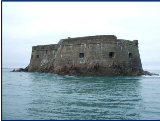
Fort de la Conchée

En 1689, Vauban est chargé par le roi Louis XIV d'inspecter les défenses des ports de la Bretagne Nord, entre Brest et Saint-Malo. Il décide alors de construire, avec l'ingénieur Siméon de Garengneau, un nouveau fort pour renforcer la ceinture militaire malouine formée par le Fort d'Arboulé, le Fort Royal, les îles du Grand Bé, du Petit Bé, d'Erbour et de Cézembre. Le but étant de fermer l'entrée de la Fosse aux Normands aux navires anglais et hollandais.