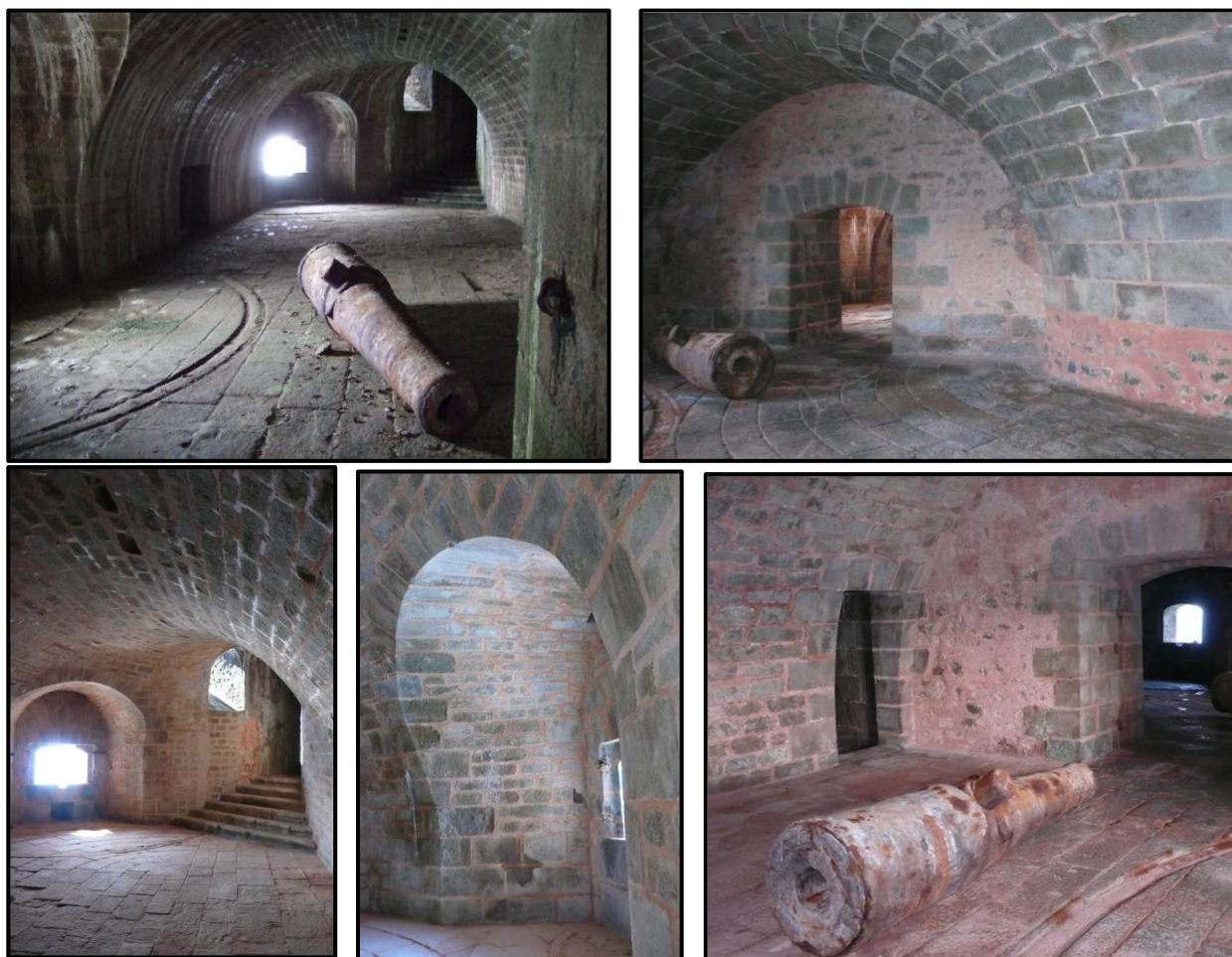
Photographie 1 : salles de tir avant restauration

Grâce au mécénat de la Fondation Total, la Fondation du Patrimoine a soutenu ce projet à hauteur de 120 000 euros, soit 100% du montant global des travaux. La restauration a débuté en 2008.