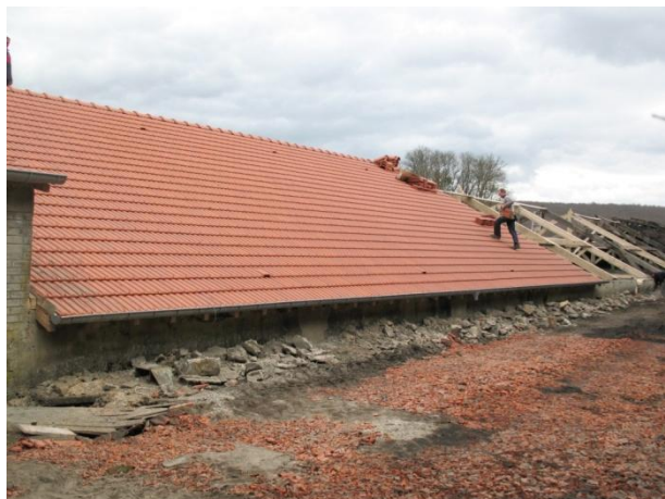
Grande halle de fonderie avant et pendant restauration