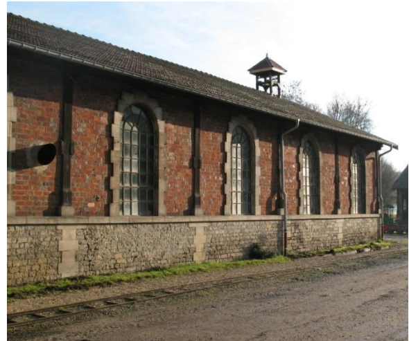
Atelier de modelage avant et après restauration