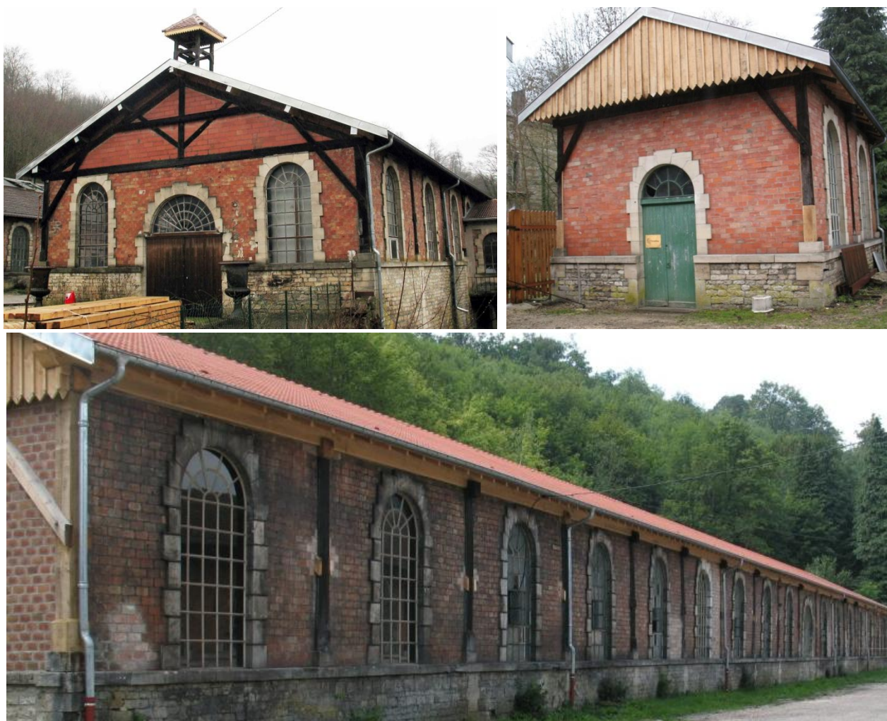
Grande halle de fonderie, atelier de modelage et magasin à petits modèles

PARTENARIAT ENTRE LA COMMUNAUTÉ DE COMMUNES DE LA HAUTE SAULX ET LA FONDATION DU PATRIMOINE