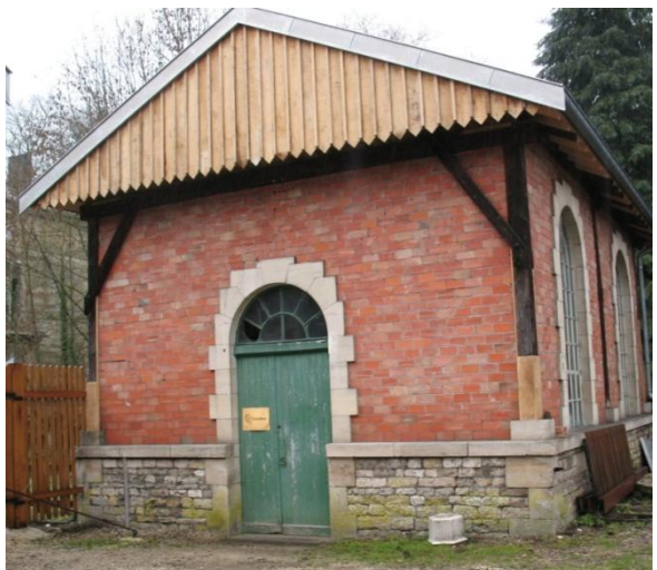
Magasin à petits modèles avant et après restauration