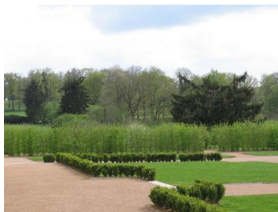
Jardin du domaine de La Borie-en-Limousin