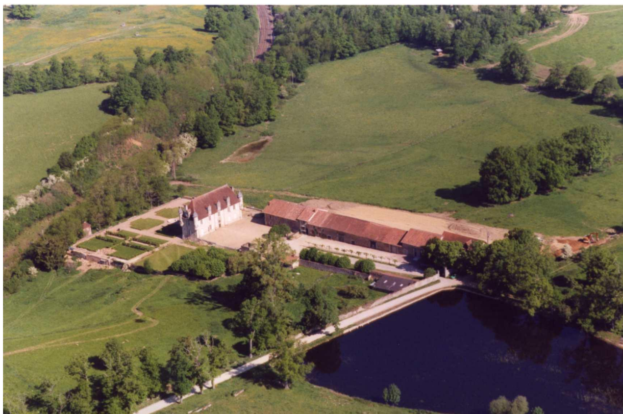
Vue aérienne du domaine de La Borie-en-Limousin

PARTENARIAT ENTRE LA FONDATION DU PATRIMOINE ET LA FONDATION LA BORIE-EN-LIMOUSIN POUR LA RESTAURATION ET L'AMENAGEMENT DU DOMAINE DE LA BORIE