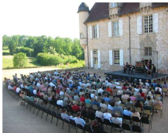
Réunion au domaine de la Borie-en-Limousin