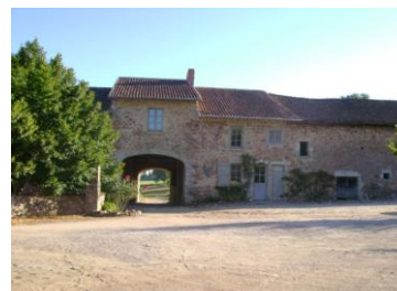
Château et dépendances du domaine de La Borie-en-Limousin