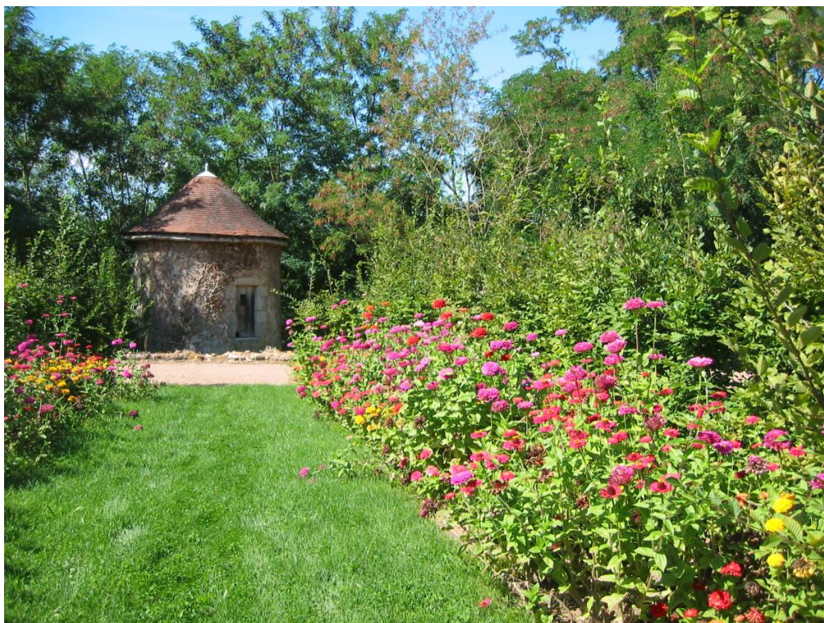
Jardin du domaine de La Borie-en-Limousin

RESTAURATION D'ÉLÉMENTS DU JARDIN EFFECTUÉE PAR DES CHANTIERS D'INSERTION