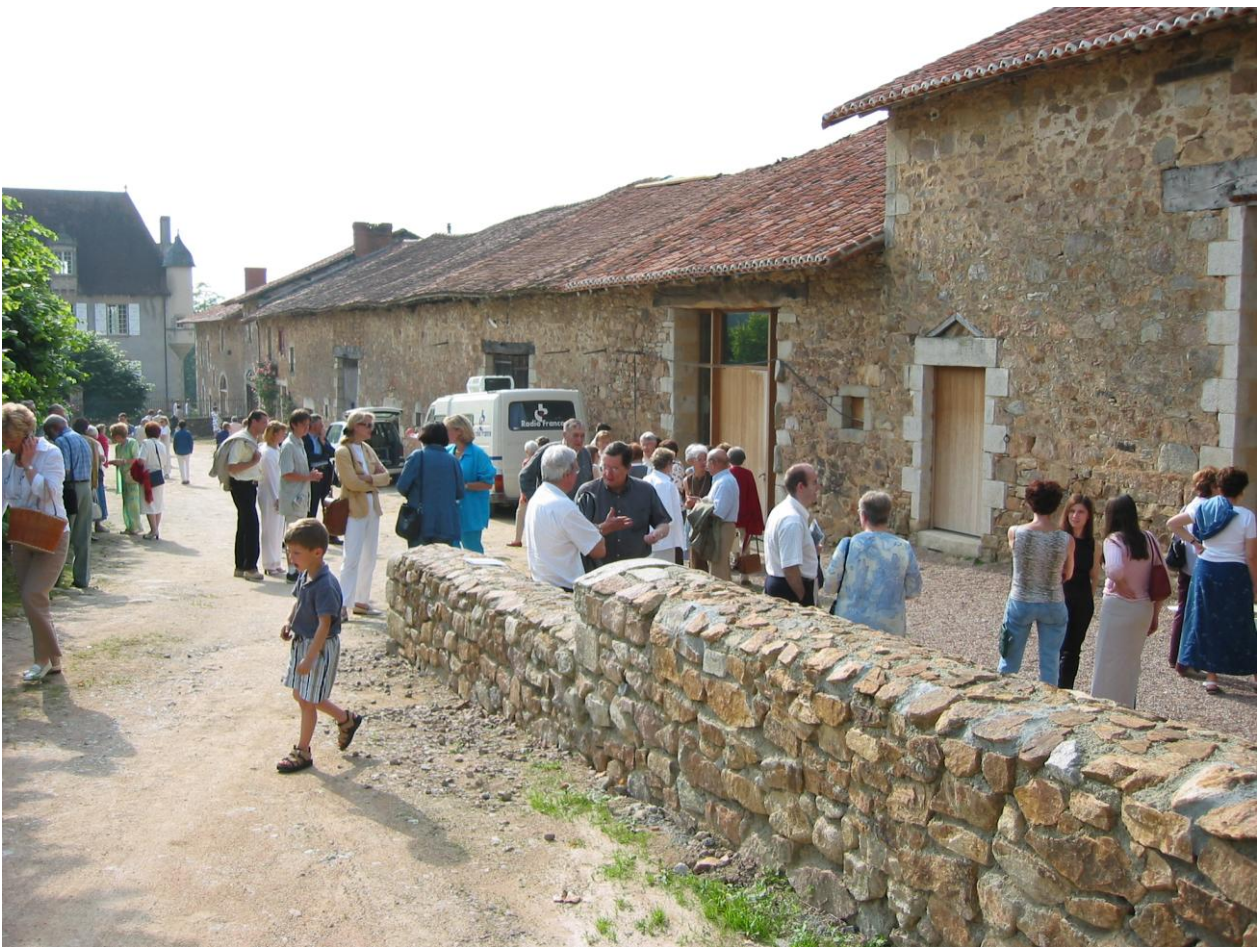
Granges du domaine de La Borie-en-Limousin