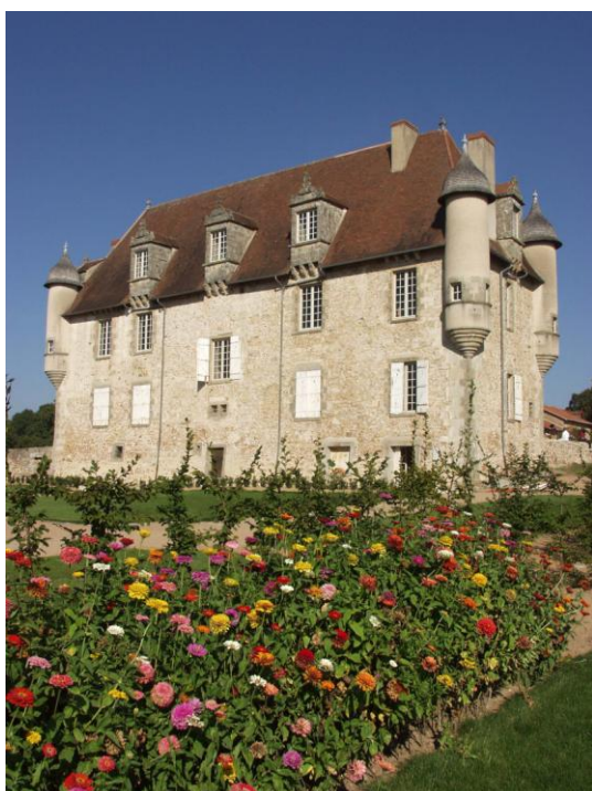
Château du domaine de La Borie-en-Limousin

Construit à une époque où les guerres de religions (deuxième moitié du XVIIème siècle) sont encore dans les esprits et où le Limousin est ébranlé par des révoltes paysannes (les révoltes des Croquants), le domaine comprend différents éléments défensifs. Un mur d'enceinte renforcé par deux tours renferme les dépendances agricoles, des jardins et le château. Ce dernier possède des tours d'angle, des mâchicoulis et des canardières. L'ensemble devait aussi permettre de résister aux pillards.