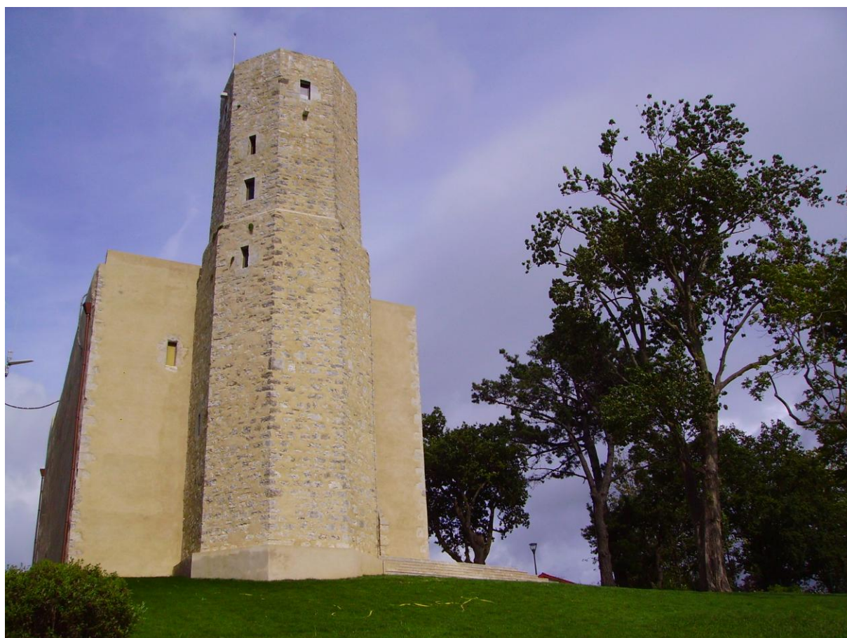
Tour de Bordagain

soutenue par la Fondation du Patrimoine, grâce au mécénat de la Fondation Total