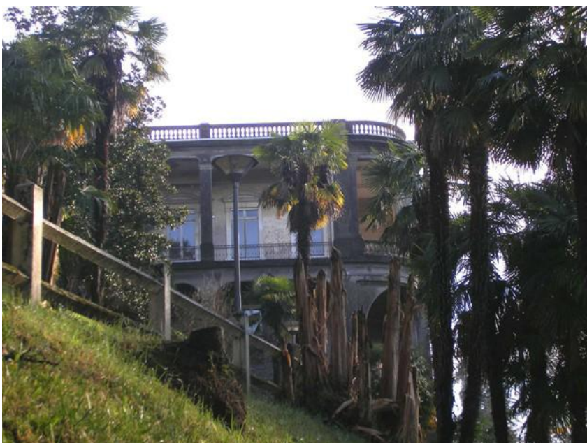
Pavillon des Arts