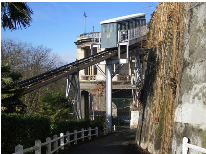
Pavillon des Arts et funiculaire

Le projet Pau porte des Pyrénées vise à redonner une identité forte à la ville de Pau en s'appuyant notamment sur les richesses patrimoniales, architecturales et naturelles de la cité.