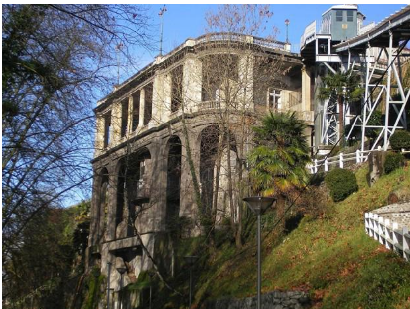
Pavillon des Arts