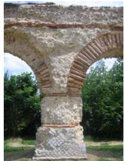
pile et amorce de 2 arches restaurées