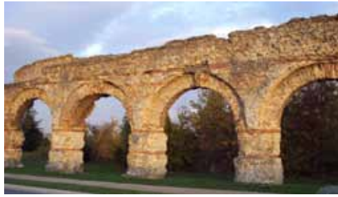
Enfilade d'arches avant restauration