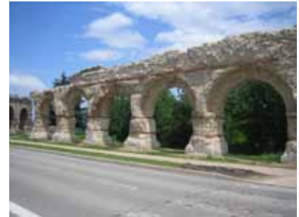
Enfilade d'arches après restauration