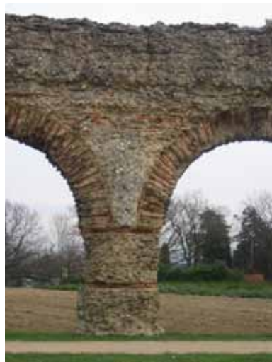
pile et amorce de 2 arches non restaurées