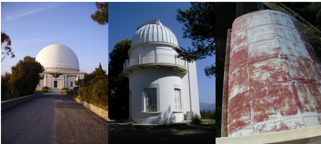
Le Grand Equatorial, bâtiment Schumasse, Toiture de l'Equatorial coudé avant restauration

Aujourd'hui, l'Observatoire de la Côte d'Azur se compose de quatre unités de recherches et emploie près de 450 personnes dont 150 chercheurs.