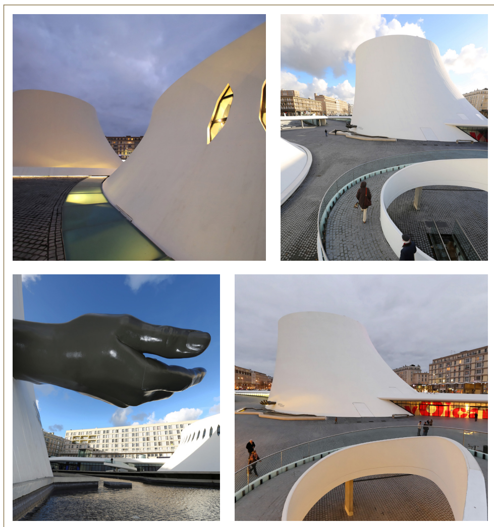
Espace Oscar Niemeyer

Pour mémoire, en 2009 la Fondation du patrimoine et la Fondation Total ont participé à la restauration de 57 sièges (fauteuils et poufs) créés par Oscar Niemeyer. Ces mobiliers ont retrouvé toute leur place au sein des deux édifices restaurés.