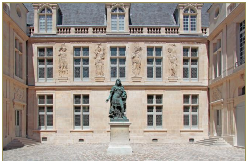
Cour d'honneur Louis XIV restaurée

Consultez l'ensemble des projets soutenus par les deux Fondations sur le site www.fondation-patrimoine.fondation-total.org