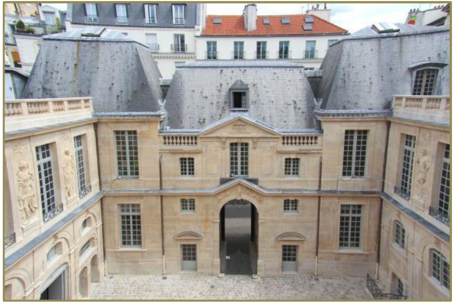
Cour d'honneur Louis XIV restaurée