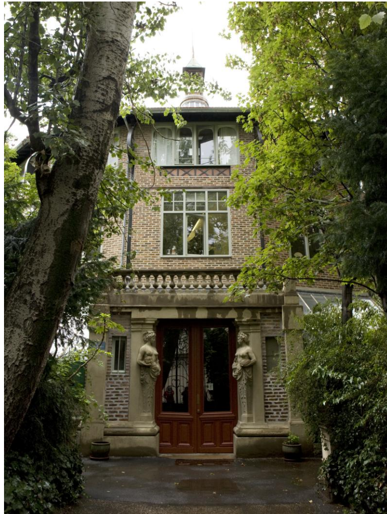
Cité d'artistes « La ruche », passage de Dantzig, 75015 Paris

PARTENARIAT ENTRE LA FONDATION DU PATRIMOINE ET LA FONDATION LA RUCHE-SEYDOUX POUR LA RESTAURATION DE LA ROTONDE DE « LA RUCHE »