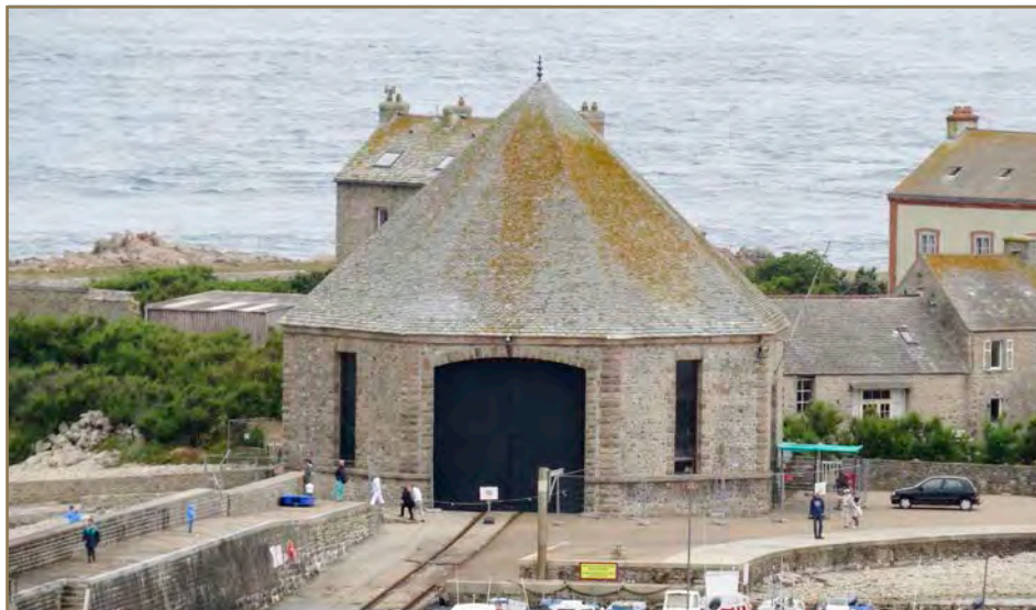
Abri du canot de sauvetage de Goury