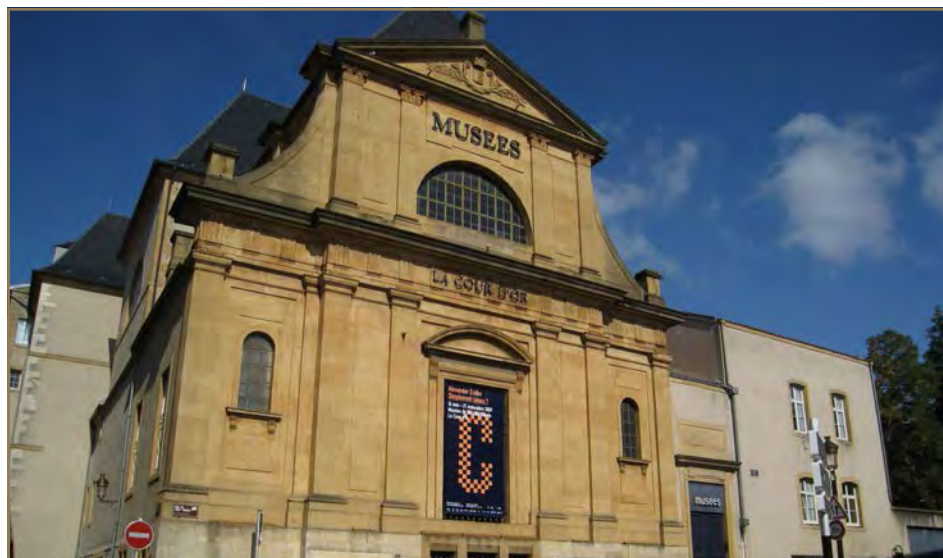
Musée de la Cour d'Or