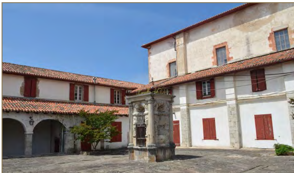
Couvent des Récollets avant travaux