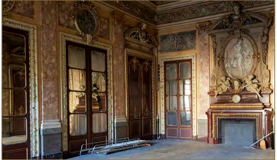
Salle Mounet Sully avant travaux