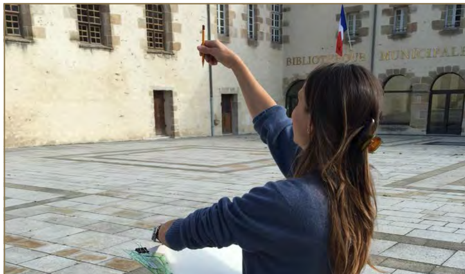
Ateliers sur site de Dinan © Lydie Fouilloux – École de Chaillot