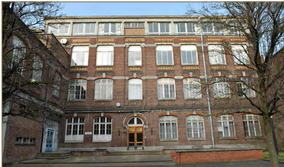
Ancien Institut Sévigné, nouvelle extension de la Piscine de Roubaix