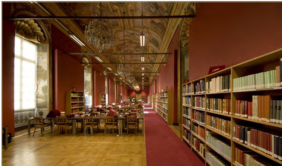
Galerie Mazarine