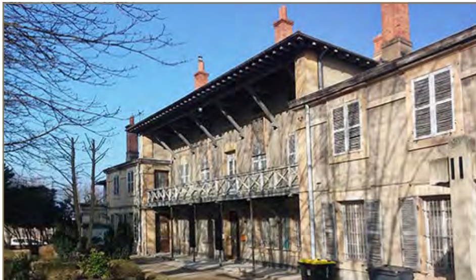
Maison des Chapelains de Fourvière