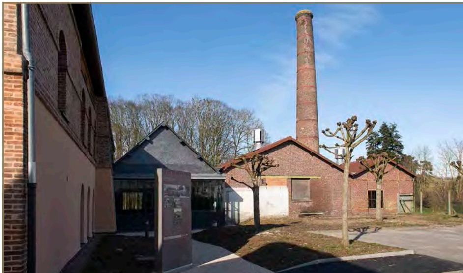
Médiathèque du Livarot